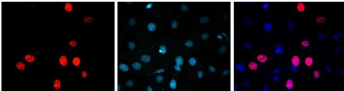
图 1. iClick™ EdU Andy Fluor 647 细胞增殖检测试剂盒检测 A549 细胞增殖的细胞成像分析结果图。

使用 10 \mu M EdU 处理 A549 细胞 2 小时，然后使用 Andy Fluor™ 647 Azide（红色荧光）进行点击化学反应检测细胞增殖情况，Hoechst 33342（蓝色荧光）进行细胞核复染。